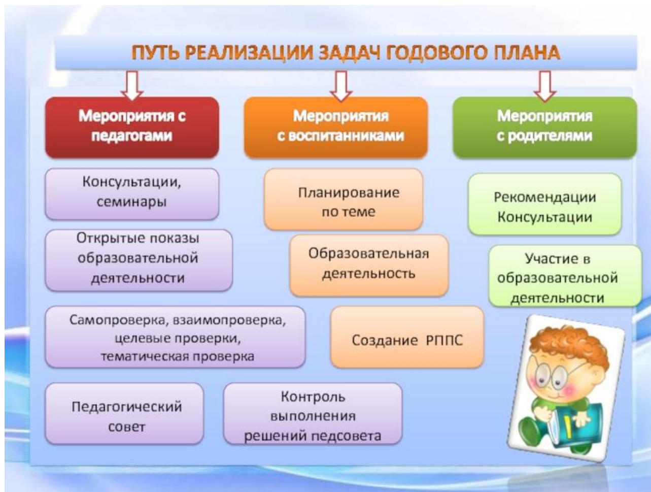
Схема реализации задач годового плана Муниципального дошкольного образовательного бюджетного учреждения Детский сад «Лесная сказка» п. Домбаровский.